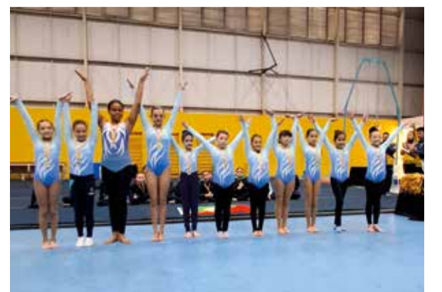
Equipe Talentos de Canoas