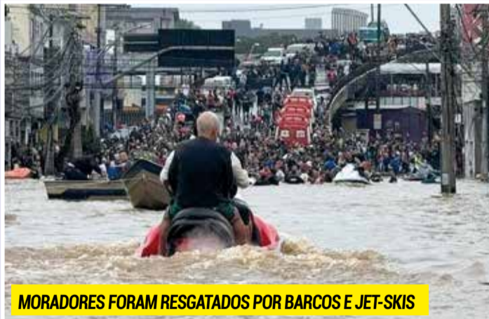
MORADORES FORAM RESGATADOS POR BARCOS E JET-SKIS