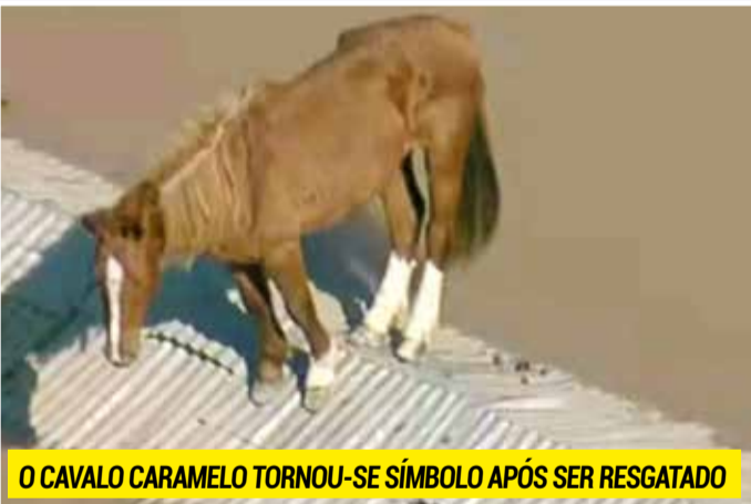
O CAVALO CARAMELO TORNOU-SE SÍMBOLO APÓS SER RESGATADO

2 ANOS DA ENCHENTE Imagens ainda vivas na memória dos canoenses