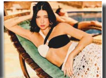
Coleção "Essência Brasileira"

Com estreia nos cinemas brasileiros nesta semana, o filme Moana 2 já é um sucesso internacional. Para celebrar o lançamento nas telonas, a Bibi apresenta uma coleção exclusiva de sandálias e acessórios inspirados na personagem da Disney.