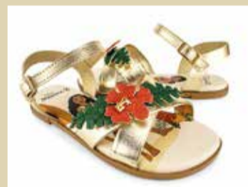
Sandália disponível nos tamanhos 22 a 35

Com estreia nos cinemas brasileiros nesta semana, o filme Moana 2 já é um sucesso internacional. Para celebrar o lançamento nas telonas, a Bibi apresenta uma coleção exclusiva de sandálias e acessórios inspirados na personagem da Disney.