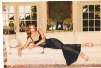
C&A lança uma nova e vibrante coleção em colaboração com a PatBO