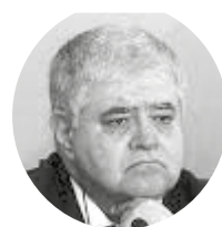
Carlos Marun Advogado e Ex-Ministro de Estado