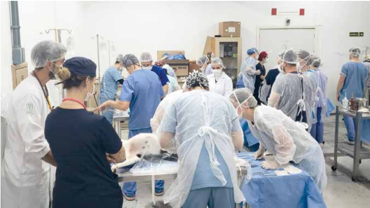
Mutirão de castrações acontece em comemoração ao Dia Mundial dos Animais