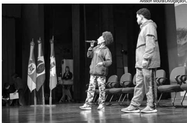
Encontro contou com apresentações artísticas

“Não estamos aqui apenas para reconstruir essas políticas em Canoas, mas reconstruir as políticas do Brasil, dando início ao processo fundamental